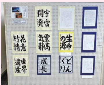
小豆島町のこどもたちの作品：39点

また、小豆島町・安慶市からは、同町・同市のこどもたちの作品が届き、第67回茨木市総合展にて展示しました。