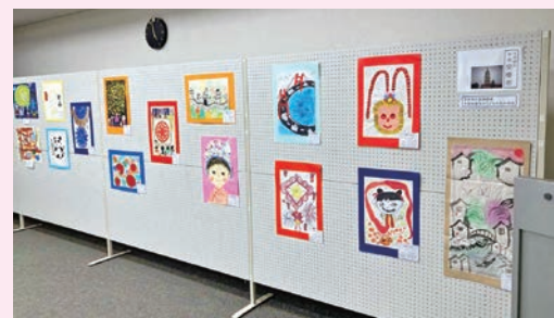
安慶市のこどもたちの作品：15点