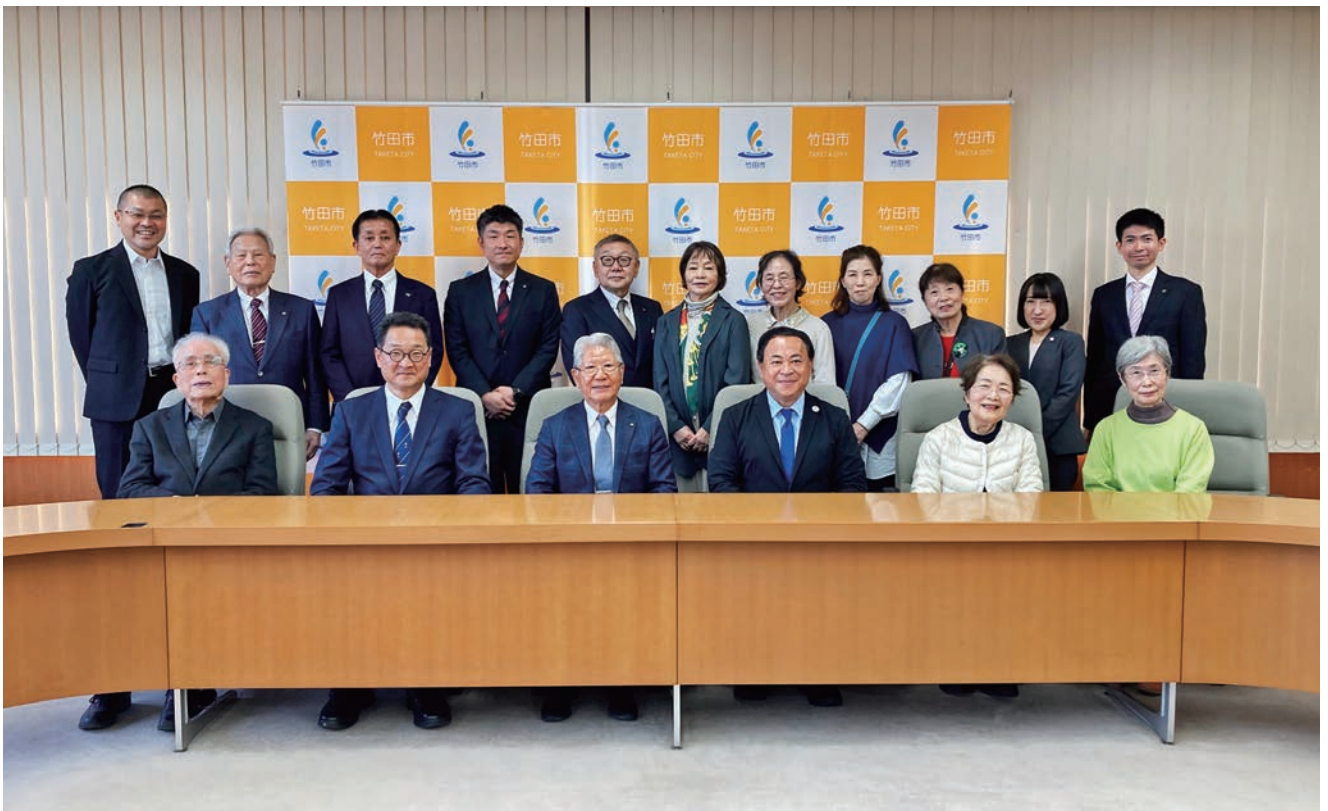
大分県竹田市 表敬訪問