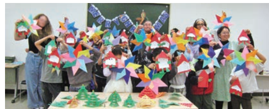
クリスマスクラフトを作りました♪ 留学生スタッフの3人も参加してくれました!

申込方法 ▶ 偶数月初めから本協会事務局まで電話または偶数月の市広報誌に掲載している二次元コードで申込み